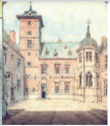
Aquarelle vers 1890, par la Comtesse de Spangen