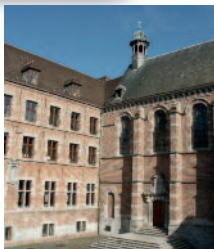
Conservatoire royal de Mons