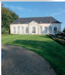
Orangerie du Château de Seneffe