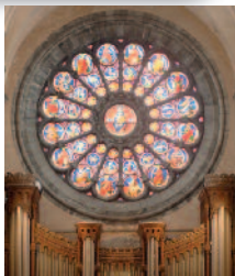
© P. Peeters Fabrique d'église cathédrale de Tournai