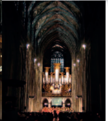
Collégiale Sainte-Waudru