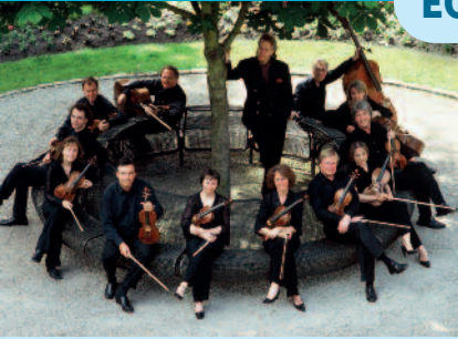
L'Orchestre Royal de Chambre de Wallonie