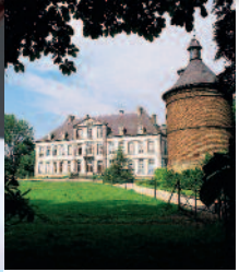
Château d'Attre