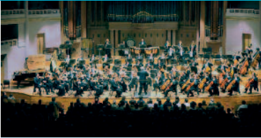
Orchestre National de Belgique

CHARLEROI HORNU MARIEMONT MONS SOIGNIES TOURNAI