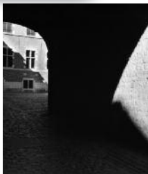
Conservatoire royal de Mons