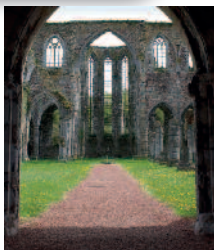
Abbaye d'Aulne