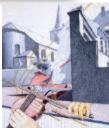
Eglise de Roisin