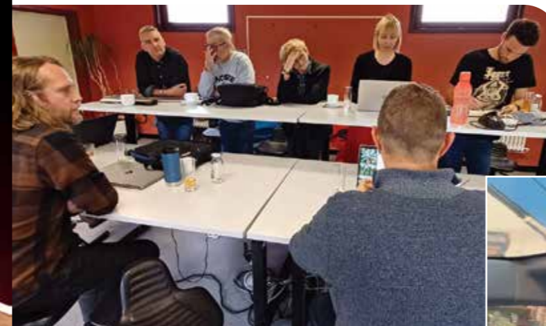
Du théorique au terrain, naissance d'un nouveau concept

Les sels de nicotine rendent accro, les arômes chauffés irritent et affectent les voies respiratoires. En