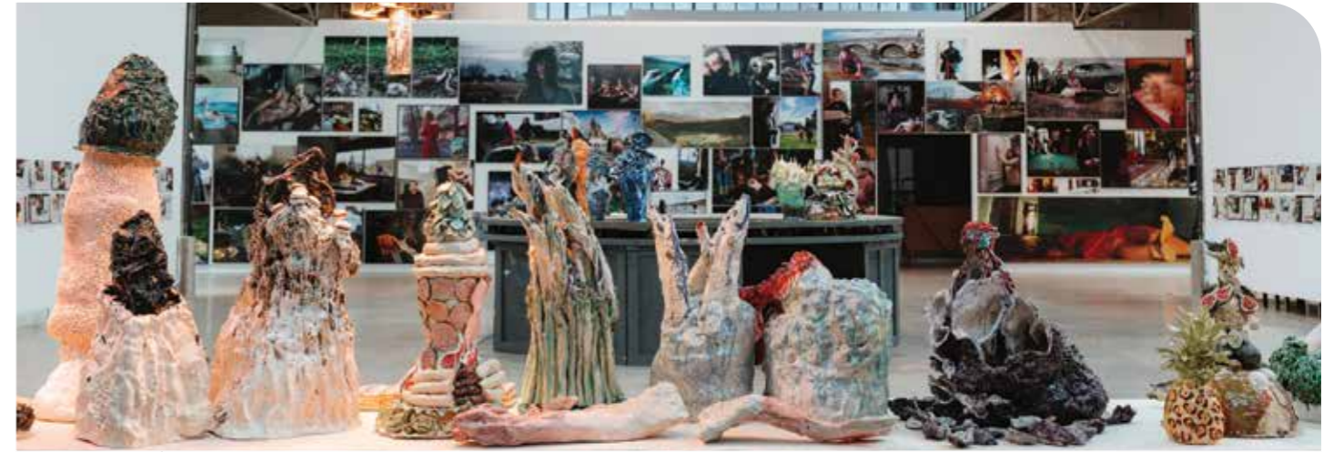
Bachelot & Caron, Porcelaine et faits divers (vue d'exposition), BPS22, 2026.